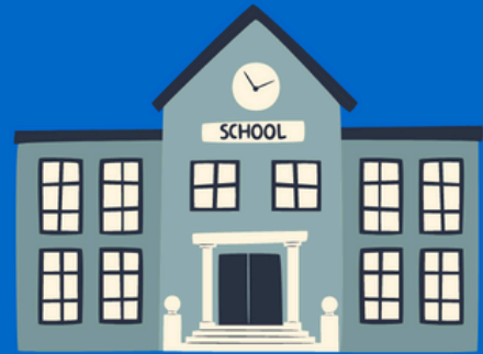
SCUOLA MATERNA GRIMM