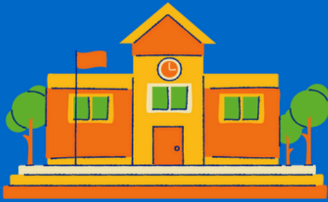
SCUOLA DON CAMAGNI